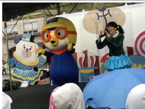
周末活動不定期邀請Pororo至 站前廣場桑塔熊舞台與民眾互 動，讓市民家庭生活更幸福。