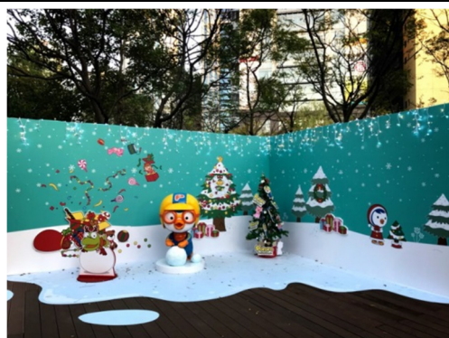
結合性別平等宣導企鵝意象， 打造萬坪公園卡通燈區 Pororo 裝置