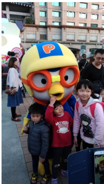
周末活動不定期邀請Pororo至 站前廣場桑塔熊舞台與民眾互 動，讓市民家庭生活更幸福。