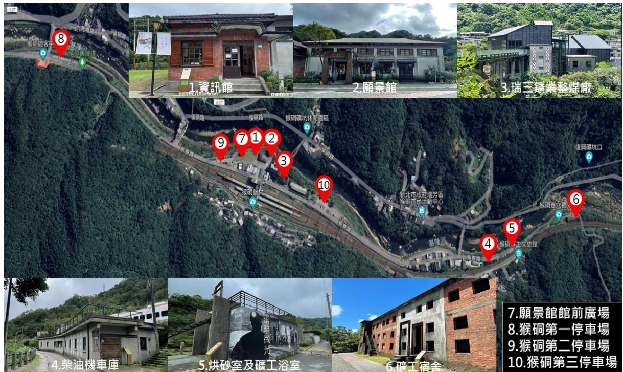
圖 2-1 本案委託範圍及其相對位置示意圖