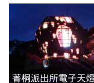
菁桐派出所電子天燈