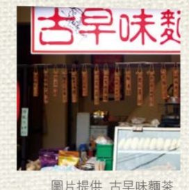
圖片提供 古早味麵茶

濃濃的花生與芝麻香氣加上熱騰騰的開水沖泡而成的麵茶，香氣濃郁，而且為了重現古早年代沿街叫賣麵茶時總會先聽到茶壺沏茶的聲音，老闆也如法炮製，在滾燙開水沖入麵茶粉時，店內鳴起的汽笛，十分有趣。此外，老闆也別出心裁推出冰麵茶，特殊的口感別具風味。 地址：平溪老街