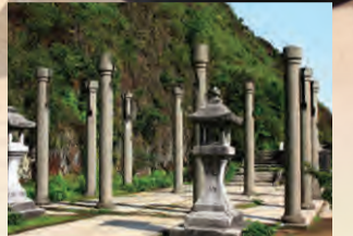
N25° 06' 19.2" E121° 51' 33.7"

황금박물관원구의 최상봉에 위치하여 1993년 진과쓰 채광장은 일본 광업주식회사가 광산을 인수 관할하였다. 스펙상 아래 방향으로 약 300 미터 쪽의 산 중간에 건축한 황금신사는, 신사내에서 주요로 섬기는 신은 진우즈신으로, 일본 시마네현의 진우즈 신사에서 본령을 해온 것이다, 이는 아금, 단아업의 보호신이다.