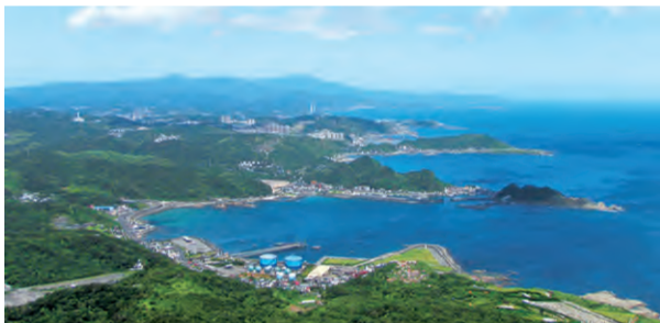
N25° 06' 42.0" E121° 50' 51.3"

지룡산에 올라 멀리서 여항을 바라보면 낮은 마음이 탁 트이고, 밤엔 많은 별들이 점점이 박혀있어 하루의 근심을 잊을 수 있다. 표고 약 587 미터로 수려하게 우뚝 서 있어 여기서는 시야가 확 트여 한눈에 들어온다. 지룡산 등산로 입구는 거머 102 선도 좌측에 위치하는데 꼭대기에 도착하려면 한 시간 걸린다. 꼭대기 관타오핑(파도 감상하는 곳)에서의 시야는 탁 트여 360 도로 다 볼 수 있다. 비도우자오 동북 해안을 따르면, 수이난동, 진과쓰, 뽀우쯔, 평화섬 등 아름다운 바다 경치가 눈 아래 펼쳐진다.