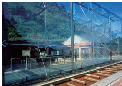
N25° 06' 29.8" E121° 51' 24.2"

진과쓰 발전사가 기록되어 있는 가장 중요한 명소로 아름다운 철근 유리 장막식 구조물로 한쪽에는 번산 5 경의 금광문화유산을 보존하고 있다. 구역 내에는 산케 키쿠지로터택, 일본식기숙사, 연금건물, 환경관, 타이뜨여관 등등 각자의 특색이 있다. 황금박물관내에는 금광원석, 연금화로, 황금 구운기구, 채광 및 착광 도구들이 전시되어 있고, 현지에서 전통의 사금 채취 및 연금 과정을 공연하고 있다.