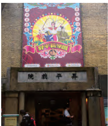
N25° 06'31.6"E121° 50'36.1"

자주 대만 영화나 광고영화 속의 촬영 배경이 되던 곳이다. 일본 식민지 시대에 지어졌다. 건축물의 특색과 부근 경치가 3,40 년대의 시공간적 특색을 갖추고 있었기 때문에, 영화 「비정성시」 「도우상」, 그리고 지명도 있는 광고 블루마운틴 커피의 감독들이 그 농후한 인간 문화적 정취에 깊이 감동 받아 이곳을 배경으로 삼았다.