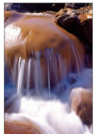
N25° 07' 04.5" E121° 51' 42.2"

진과쓰 수이난동 방향으로 구불구불한 진수이도로 옆에 있는 황금폭포의 등차의 아름다움은 사람을 놀라 흥모케 한다. 그 명칭은 진과쓰에서 생산되는 광물모래가 산속 생물과 빗물에 씻겨 바위에 가라앉아 물속 가득히 함유된 황철광, 중금속 비소들의 색깔로 인해 황금색 폭포 경관을 만들어 낸다. 경치가 아주 아름답고 물살이 아주 드세니 촬영을 좋아하는 이에게는 결코 지나칠 수 없는 촬영명소이다. 폭포 옆의 타이진 구채광장에 서면 음양해의 특별한 경관을 감상할 수 있다.