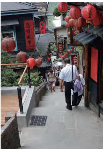
N25° 06'35.3"E121° 50'37.5"

건축물의 소박한 아름다움, 짙은 예술적 특색과 문화의 숨결, 이는 옛 거리의 아름다운 풍경을 묘사한 것이다. 유명한 먹거리와 역사적 건축물이 모두 옛 거리에 있고, 전망대에 올라 조용히 지우편의 바다 풍경을 감상할 수 있다. 쉬치로는 특별한 「풍(丰)」 자 도로가 있는데, 지우편의 직선 도로이다. 크히 드문 계단길에는 경치를 바라볼 수 있는 찻집이 있어 향수를 느끼게 한다. 그리고 지산가에는 맛있는 위안(생선완자), 위웬, 어패커야가 있다. 휴일만 되면 많은 인파로 떠들썩해 진다.