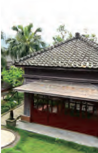
N25° 06' 28.8" E121° 51' 29.8"

서기 1922년에 건립, 건축물의 주재료는 전나무와 삼나무로 아주 옛스럽고 고풍스럽다. 여관의 특징은 철못을 사용하지 않고, 나무에 흙을 내 연결하는 방식으로 완성하였다. 거실, 서재, 응접실 등의 구조가 아주 우아하다. 거기에 정원 조경, 백년 고목과 연못이 공간적으로 부각되어 관광객을 매료시키며 당시의 시공간적 인 아늑하고 고상한 아름다움을 엿볼 수 있다.