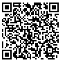
新北市觀光旅遊網

觀光旅遊局表示，新北市幅員廣大，山海觀光資源豐饒，近一年來，除了打造觀光新品牌「青春山海線」串連從淡水到三貂角的旅遊景點，及兼具歷史人文特性的台灣朝聖之路「淡蘭古道」外，並結合地方創生、綠色旅遊，鼓勵更多的年輕人返鄉投入，本次獲得亞太最佳旅遊目的地獎，不僅展現新北的觀光軟實力，也將吸引更多國際觀光客來新北旅遊。