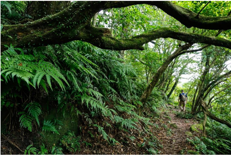
富含歷史與人文底蘊的淡蘭古道-燦光寮古道