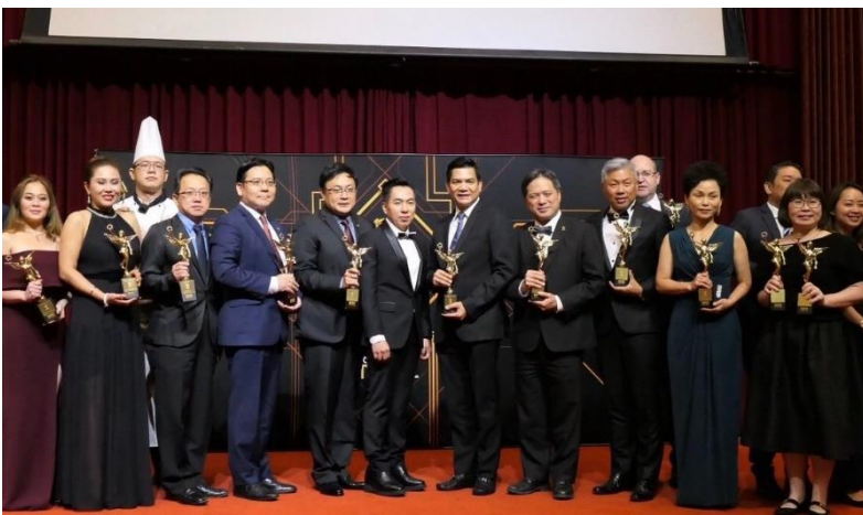
「亞洲地區年度旅遊大獎」各國得獎者會後大合照