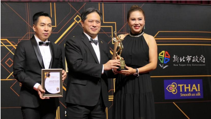
由新北市吳明機副市長領取「亞太最佳旅遊目的地獎」